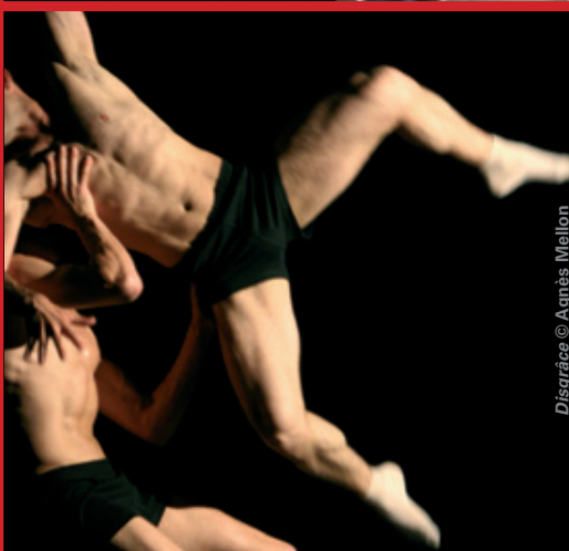
Disgrâce © Agnès Mellon