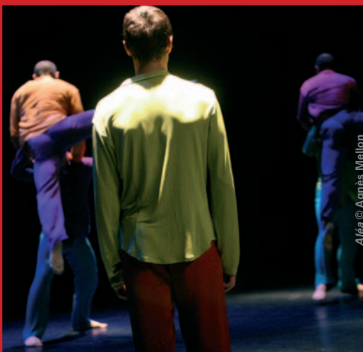
Aléa